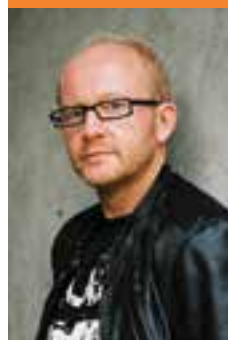
Dieter Falk Komponist

Im Laufe seiner Karriere erhielt er 79 Goldene- und Platin-Schallplatten. 2005 gewann er den Echo für sein Lebenswerk - die höchste Ehre, die Deutschlands Musikbranche zu vergeben hat.